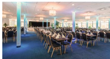
Fint boende i 2, 3 o 4-mannarum och bra mat på hotell Ronneby Brunn