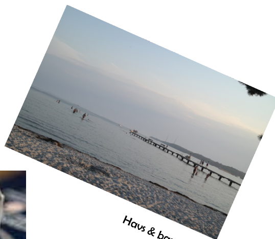
Havs & bassängbad